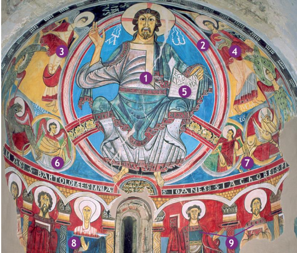
Pantocràtor de l'absis de l'església de Sant Climent de Taüll (Lleida), construïda al segle XII